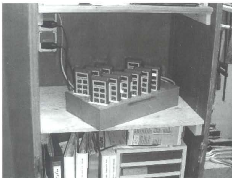
Über eine Ladestation, die im Betrieb steht, werden die aktuellen Aufträge und Tätigkeiten geladen

Das Erfassungsgerät ist kaum größer als eine Zigarettenschachtel und sehr einfach zu bedienen. „Jeder Mann trägt sein eigenes Digi-Raport am Gürtel. Auf dieses Gerät werden über eine Ladestation, die im Betrieb steht, die aktuellen Aufträge und Tätigkeiten geladen. Morgens schaltet der Mitarbeiter sein Gerät ein. Das entspricht der ‚Kommen‘-Buchung. Über vier Tasten wählt er dann seinen aktuellen Auftrag und die Tätigkeit aus. Die eingebaute Uhr