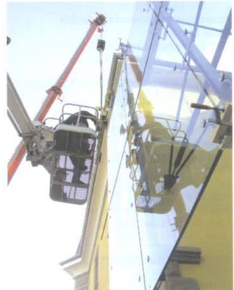
Die Firma Ziegler + Dietrich, Singen, fertigt hochwertige Fenster, Türen und Fassaden sowie Sonderanfertigungen aus Leichtmetall. Zu den Kunden der Aluminiumspezialisten zählen u. a. Hugo Boss oder Alcan

Seit Anfang des Jahres 2000 gibt es bei Ziegler + Dietrich keine handgeschriebenen Auftrags- und Stundenzettel mehr. Eine Kombination aus mobilen Zeiterfassungsgeräten („Digi-Raport“) für die Mitarbeiter in der