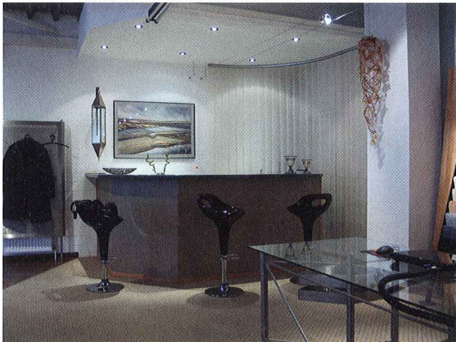
Im Showroom kann sich der Kunde über Gesamtlösungen für alle Fragen des Innenausbaus und der Renovierung informieren.